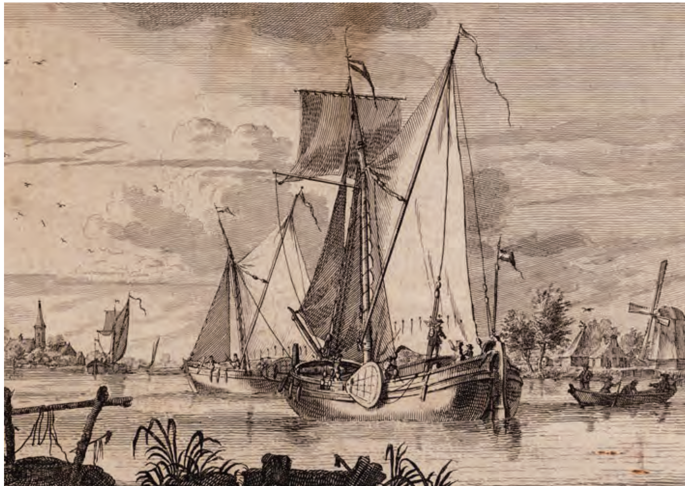
Afb. 1. Een 'Smalschip of Dam-schuyt', 1700-1750.