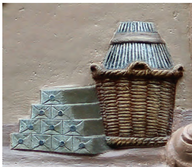
Afb. 6. Pijpenmand met lange pijpen en pakjes brieftabak met lakzegel van fabrikant op gevelsteen D'Goysse Boer in de Eerste Looiersdwarsstraat 125 te Amsterdam.