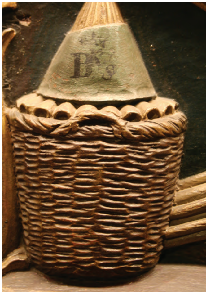
Afb. 3. Pijpenmand gevuld met lange BS gekroond pijpen op uithangbord Fa. P.J. van der Want Azn., Gouda (1898-1910).